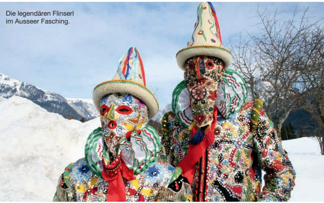
Die legendären Flinslerl im Ausseer Fasching.